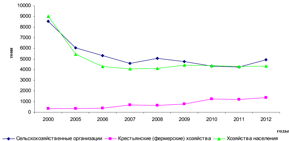
Производство молока сельскохозяйственными производителями Мценского района

Происходит неуклонное снижение численности поголовья крупного рогатого скота. С 2000 по 2012 год численность крупного рогатого скота снизилась с 23,1 тыс. голов до 8,03 тыс. голов, поголовье коров снизилось с 5,7 тыс. голов до 2,18 тыс. голов (таблица 1). В 2012 году впервые за 2 года удалось остановить падение численности поголовья коров (+86 голов).